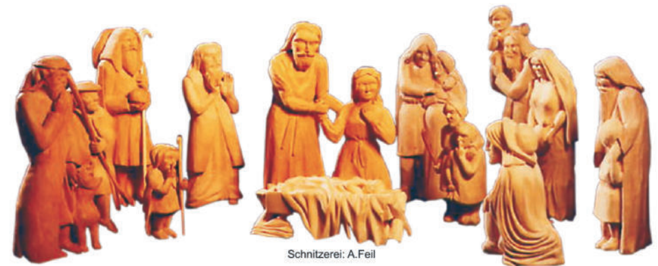
Schnitzerei: A. Feil

„Advent - Barrierefrei auf dem Weg zu Gott“